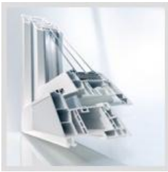
Plastová okna GENEÓ®