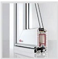
Dveře REHAU Brilliant Design