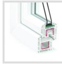
REHAU Brilliant Design