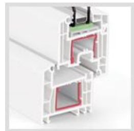
REHAU Euro Design 70