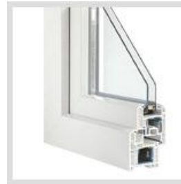
REHAU Brilliant Design MD